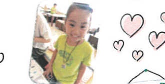
アロマネックレス作り