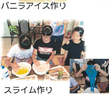
バニラアイス作り