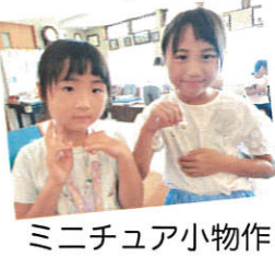
ミニチュア小物作り