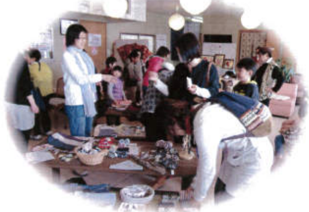
《手作り品バザー》 奇数月に行っているバザー 多くの方でにぎわいました。次回5/17

~近隣大家族は、だれでもいつでも気軽に過ごせるみんなの居場所 この街で自分らしく生き抜くために~