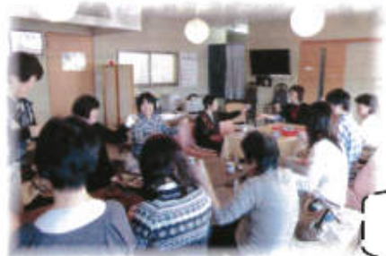
脳を元気に! 免疫力UP!