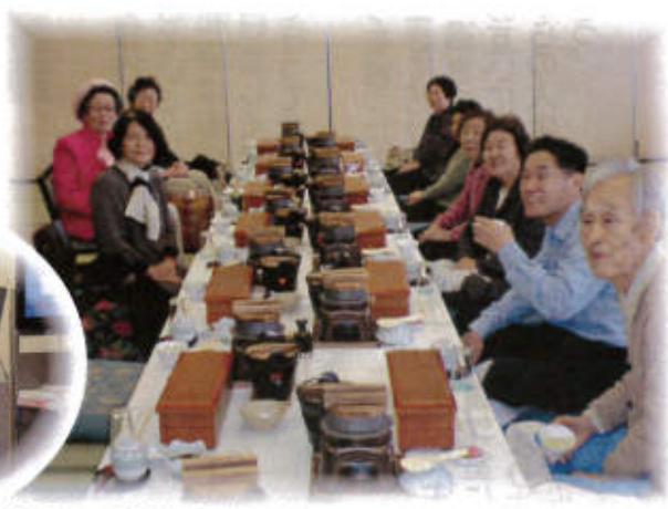
《お出掛けツアー》 温泉であたたまり、おいしい食事に舌鼓!食後のカラオケも盛り上がりました。