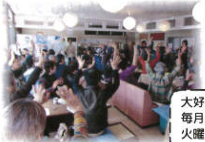
大好評! 毎月第三 火曜日!