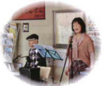
《歌声喫茶カズン》 大人気!みなさん ぜひ参加して下さいね。