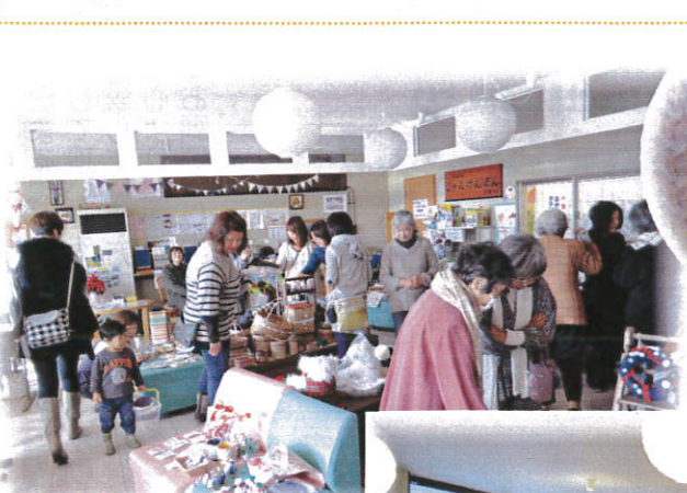
↑＜手作り品バザー＞ 今回も沢山の人が賑わいました。

＜近隣大家族メニュー＞ 飲み物（珈琲・紅茶等）… 200円 とっておきランチ … 400円 チーズケーキ … 150円