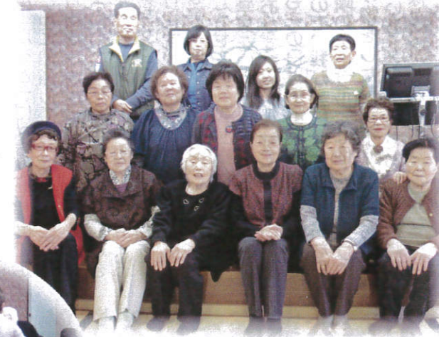
＜お出掛けツアー＞ 今回は皆さんで「榛名湖旅館高原」にお出掛けツアーに行きました。

皆さん今年も1年間元気に過ごせましたか？ 近隣大家族はいつでも誰でも気軽に過ごせるみんなの居場所です。 来る年も元気に自分らしく過ごせるようにみんなで頑張りましょう！