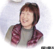
木曜日は 居場所担当です