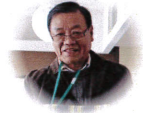
心強いサポーター