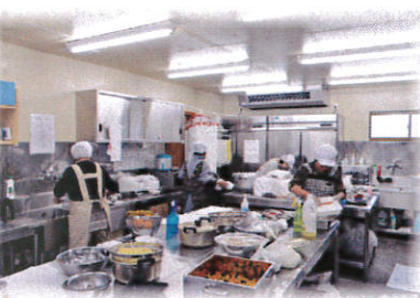
夜の食事を 作っています