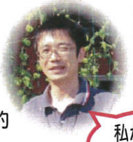
私が相談に応じます。

じゃんけんぽんの介護支援専門員・社会福祉士による相談会です。 ・家族が認知症で困っている ・家族に障害者がいる 等 高齢者・障害者のちょっとした困りごとの相談日です。事前予約も受け付けます。当日でもOK。 相談がある方は下記連絡先までお電話下さい。