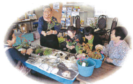
《苔玉教室》 夏の草花の苔玉作って家に飾り、涼しさを演出しましょう!