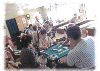
《マーじゃん教室》 みんなでマーじゃんをしながら交流を深めましょう!