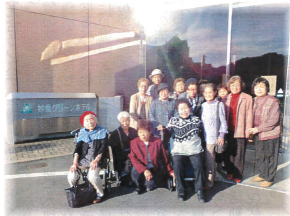
《温泉ツアー》 妙義グリーンホテル。眺め抜群でした。 紅葉が見ごろを迎えきれいでした。