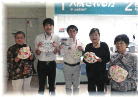
《タオル帽子お届けの様子》

今、近隣大家族でがん患者さんに送る「タオル帽子作り」を行っています。地域の皆さんが自由に参加でき、簡単な運針で、かわいい帽子が出来上がります。そして、皆さんが心を込めて一針一針縫った帽子を、群馬大学付属病院や西群馬馬病院、その他たくさんの方の病院や高齢者施設等に届けています。