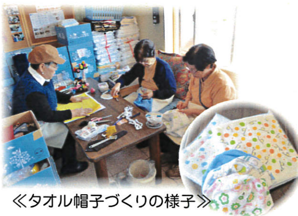
《タオル帽子づくりの様子》

病院の患者さんや施設の利用者さんからは、大変喜ばれています。皆さんも困っている人や弱い人の為に一針だけでも参加してみませんか？針仕事は女性だけではありません。男性ももちろん参加OKです。針仕事をしたいことのない方でも、若男女どなたでも参加できます。皆さんが丁寧に教えてくれます。