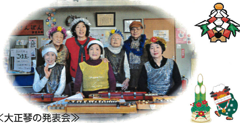
《大正琴の発表会》 いつも大正琴を練習しているメンバーで練習の成果を発表する会を行いました。演奏に合わせてみんなで歌う一幕も!