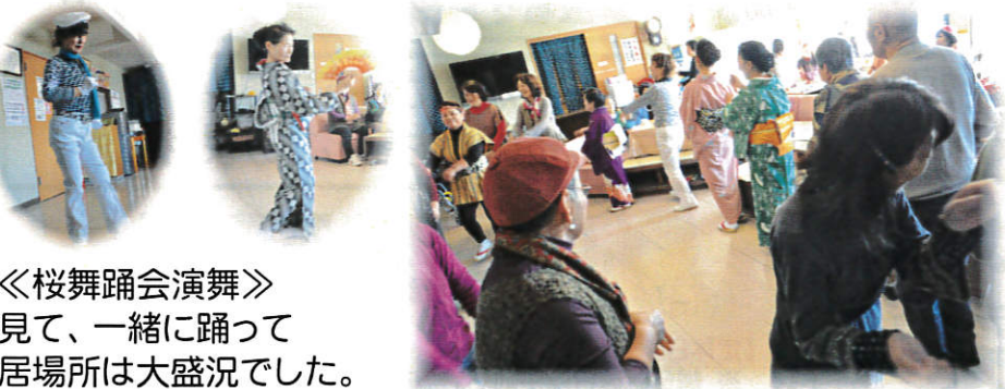
《桜舞踊会演舞》 見て、一緒に踊って居場所は大盛況でした。

昨年はたくさんの皆様が近隣大家族に集い、みなさんそれぞれに自分の居場所・役割・生きがいを見つけられましたね。今年も元気に地域で生ききる為にお互い助け合いながら、頑張っていきましょう。