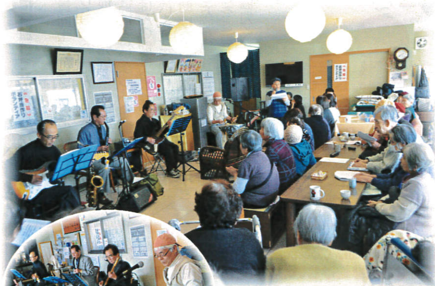
↑《サニートーパス バンド演奏会》 参加者 62名。みなさん一緒に生演奏で歌いました。

～近隣大家族は、誰でもいつでも気軽に過ごせるみんなの居場所 この街で自分らしく生き抜くために～