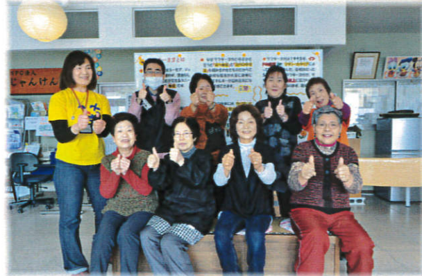
↑《ラフターヨガ》 笑いのヨガです。 みんなで笑って元気になりましょう!!