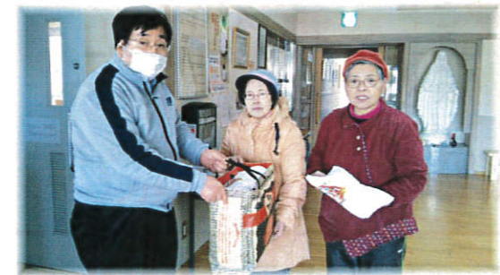
← 《雑巾お届け》 タオル帽子の会で、 フランスコノ町の子ども さんたちに手縫いの雑巾を 届けました。