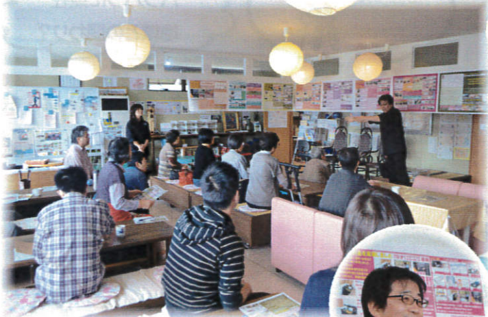
「葬儀勉強会・座談会」 葬儀に関する勉強会を行い、 葬儀について学びました。