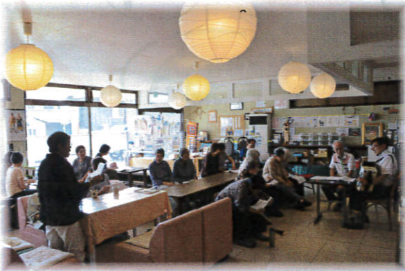
「アコーディオン演奏会」 懐かしの曲をアコーディ オンの伴奏にあわせて みんなで唄いました。