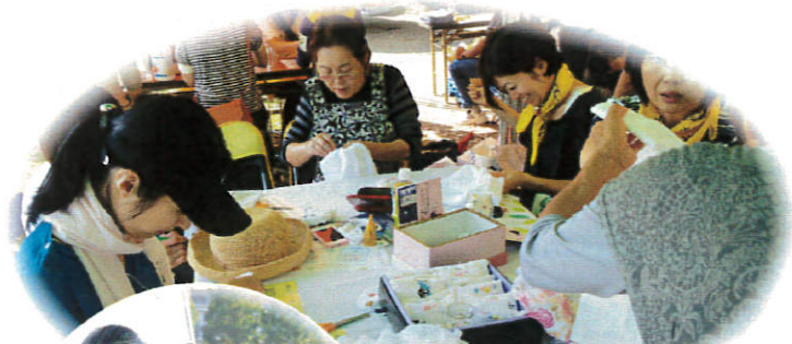
「リレー・フォー・ライフ・ジャパンぐんま」に参加しました

~近隣大家族は、誰でもいつでも気軽に過ごせるみんなの居場所 この街で自分らしく生き抜くために~