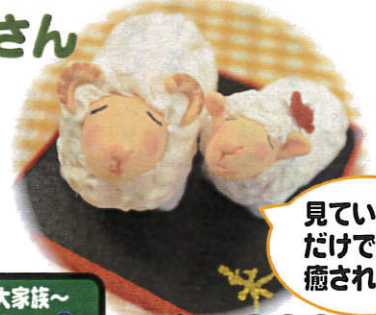
見ている だけで 癒されます。