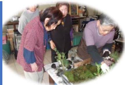
《いきいきサロン・苔玉作り》↑ 苔を使ったとても味のある素敵な作品が出来ます!