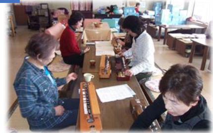
《大正琴》↑ 春の桜のように綺麗な音色の大正琴をぜひ聞いてみませんか?