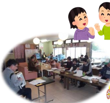
《アコーディオン演奏会》↑ 素敵な和音が心を癒します一緒に歌も歌いませんか?