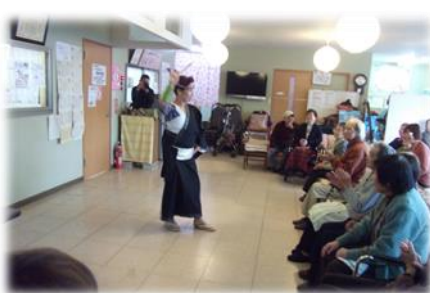
《桜舞踊会》↑ 元気のよい舞で見ている側も笑顔が溢れます☆

~近隣大家族は、だれでもいつでも気軽に過ごせるみんなの居場所 この街で自分らしく生き抜くために~