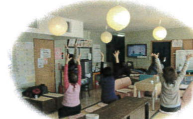
《ゆるり体操》↑ 無理せずリラックスしながら体操ができます☆★