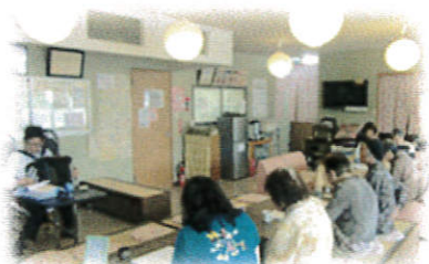
《アコーディオンの会》↑ 懐かしの曲とアコーディオンが心に響きます~♪

~近隣大家族は、だれでもいつでも気軽に過ごせるみんなの居場所 この街で自分らしく生き抜くために~