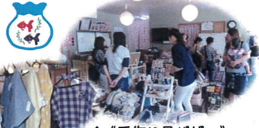
↑《手作り品バザー》 子供さんから高齢者まで みんなが楽しめます♪

~近隣大家族は、だれでもいつでも気軽に過ごせるみんなの居場所 この街で自分らしく生き抜くために~