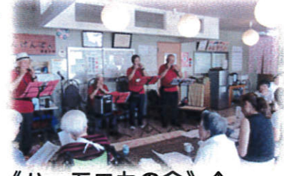
《ハーモニカの会》↑ 懐かしの曲に合わせて、楽しく歌いました♪

日差しが強く、日陰が恋しい季節になりました。 みなさん、調子はいかがですか? 夏バテしないように無理はせず、お体を大切にしてください☆