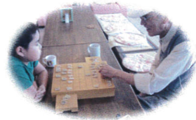
《囲碁将棋の日》↑ 世代を越えて真剣勝負!!! ここに来れば誰もが対戦相手☆