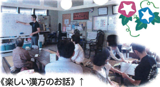
《楽しい漢方のお話》↑ 前は夏バテをテーマに身近な漢方のお話を聞き、お灸のサービスもありました☆

日差しが強く、日陰が恋しい季節になりました。 みなさん、調子はいかがですか? 夏バテしないように無理はせず、お体を大切にしてください☆