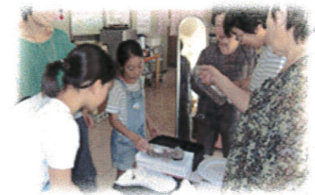
↑《もっていきん祭》 「いい物見つけた!」と欲しいものが見つかったかも☆