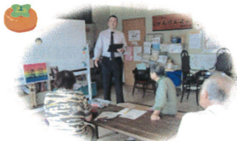
↑《わかりやすい遺言・相続のお話》 お話の後に個別の質問にも親切に答えてくださいました

~近隣大家族は、だれでもいつでも気軽に過ごせるみんなの居場所 この街で自分らしく生き抜くために~