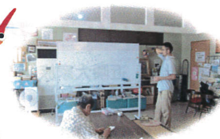
↑《楽しい漢方のお話》 季節ごとの健康に関するお話とお灸で、身も心も健やかになります☆

~ごあいさつ~ だんだんと秋の空気になり、過ごしやすい気候になってきました。季節の変わり目で体調に負担をかけやすいので体を労ってあげながら、食欲の秋を楽しんで、たくさん食べて、体力をつけましょう!