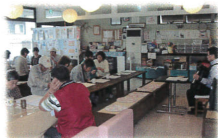
↑《アコーディオンの会》 懐かしい曲に合わせてみんなで手拍子をしながら歌いました♪