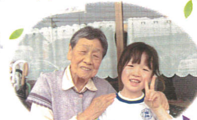
かりんちゃんも三年生になりました!

「近隣の 人々ここに 集い来て 家族のように 心通わす」田口さん作 「大家族」のように繋がることで、住みよい地域を作っていきましょう!!