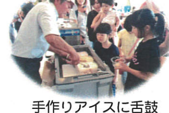
手作りアイスに舌鼓