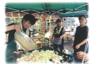
夏祭りにて焼きそばを焼く

「近隣大家族」では、今年も沢山の温かいつながりが生まれました。誰かの笑顔に力を貰えるように、あなたの笑顔もきっと誰かの力になります。笑顔のバトンをつなぎましょう!