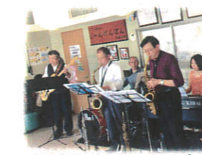
サウンドショップ5ライブ

2018年も、多くの方々に温かく支えていただき、感謝の気持ちでいっぱいです。本当にありがとうございました。来年も、どうぞ宜しくお願い致します。