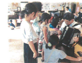
アコーディオン演奏

「近隣大家族」では、今年も沢山の温かいつながりが生まれました。誰かの笑顔に力を貰えるように、あなたの笑顔もきっと誰かの力になります。笑顔のバトンをつなぎましょう!