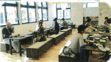
《交流も進んでいます》↑