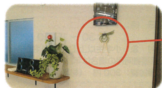
《金井淵の近隣大家族では出雲のしめ縄が見守っています》↑

~ごあいさつ~ 夏の暑さも本番に近づき、暑さの勢いが日に日に強くなってきました。飲みすぎかな?と思うくらいたくさん水部補給し、暑さに負けず、おいしい旬の夏野菜を食べて、乗りきりましょう~☆☆