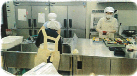
《愛情込めるボランティアさん》↑