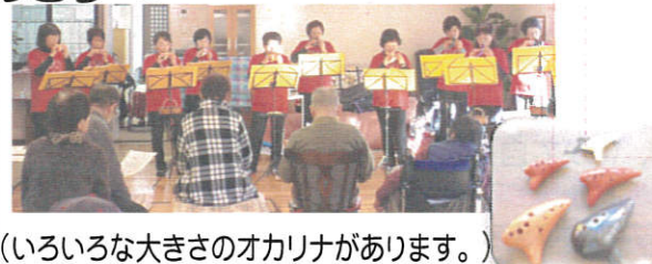
(いろいろな大きさのオカリナがあります。)

倉淵の雪の中からお越しいただいた10人以上の“ぴっころ”のメンバーの方々とオカリナの素朴な音色を楽しみました。