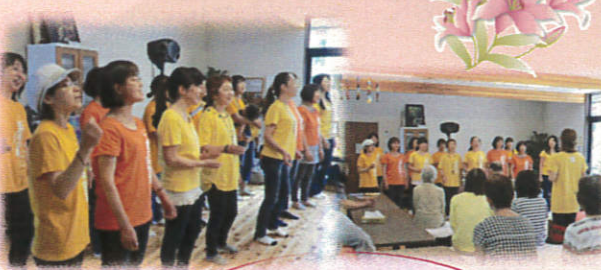
会場がひとつになり、楽しいコンサートでした。