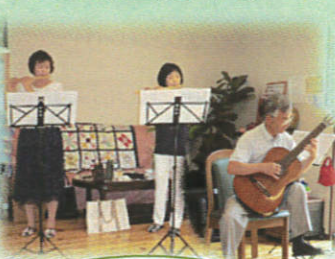
しの笛の澄んだ音色とギターのハーモニーがステキでした。