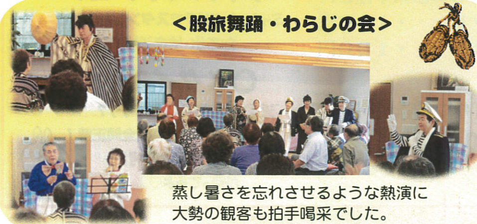
蒸し暑さを忘れさせるような熱演に大勢の観客も拍手喝采でした。