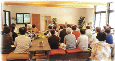
《大賑わいになった三味線》↑