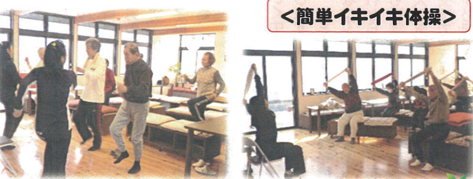
＜簡単イキイキ体操＞

~ご挨拶~ 寒さが身に染みる季節となりました。風邪に負けないために、こまめな手洗い・うがい・水分補給を心がけましょう! 近隣大家族のランチは、バランス良いメニューを栄養士さんが考えてくれています。ぜひ食べに来てください。